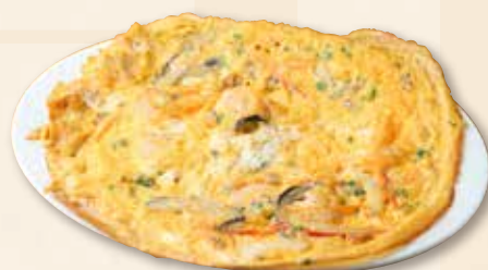
海老オムレツ ~海老の屋台風卵焼き~ 虾蛋 Prawn Omelette 【Hawker style】 950