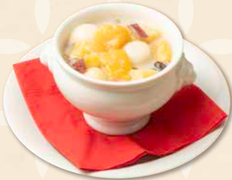
ボボチャチャ 摩摩啞啞 Bubur Cha Cha 700