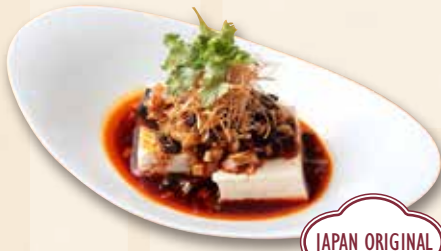
ピータン豆腐 皮蛋豆腐 Century Egg with Tofu 750