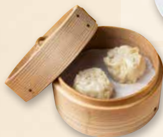
黒豚焼売 黑猪肉烧卖 Shumai of Black Pork 650