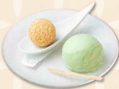
ゴマ団子とピスタチオアイス 盛り合わせ 芝麻球與開心果冰淇淋拼盤 Sesame Dumpling & Pistachio Ice Cream 660