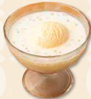
タピオカミルク 木薯牛奶 Tapioca Milk 750