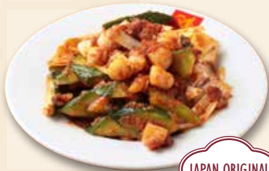
胡瓜サンバル 參巴黃瓜 Cucumber Sambal 800