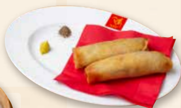
季節の春巻き 时令春卷 Seasonal Spring Rolls 600 [内容はスタッフまで]