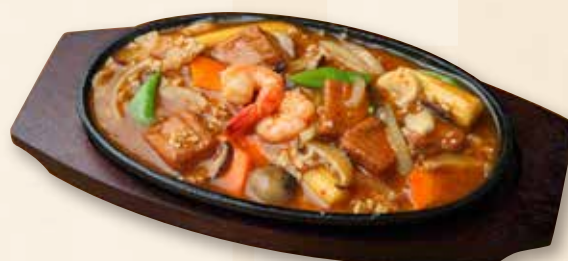
鉄板豆腐 铁板豆腐 Hot Plate Beancurd 1,400