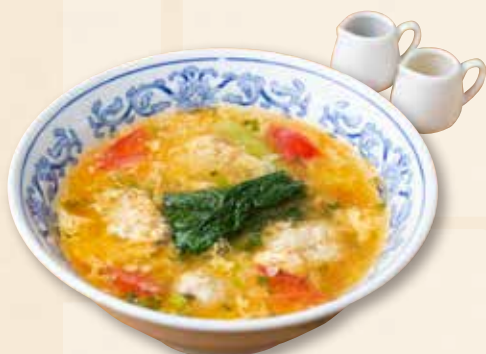
トマトと鶏団子のスープ 番茄鸡汤 Tomato & Chicken ball Soup 900