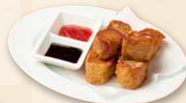
海老すり身の湯葉巻 虾枣 Deep Fried Prawn Rolls 950