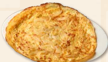
オニオンオムレツ ~玉ねぎの屋台風卵焼き~ 大葱蛋 Onion Omelette 【Hawker style】 750