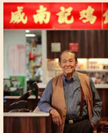
Mr.We Toon Ouut

そしてこの度、満を持して東京・田町グランパークに、シンガポール・チキンライスの トップブランドである「Wee Nam Kee」が日本に誕生することになりました。