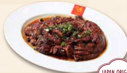
キャロットケーキ 蘿蔔糕煎蛋 Carrot Cake 850