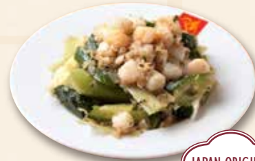
胡瓜の葱ソース 香葱醬拌黃瓜 Cucumber in Onion Sauce 750