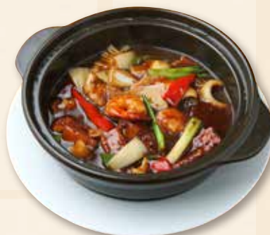
海鮮と豆腐のブラックビーンズソース煮込 豉汁海鮮豆腐煲 Claypot Beancurd with Seafood in Black Bean Sauce 1,800