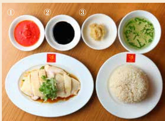
①チリソース ②ダークソイソース ③ジンジャーソース

1 まずは、鶏スープで炊いた芳醇なライスの香りを 楽しむために何もつけずにライスを一口。 (ウィーナムキーのライスは何もつけなくても十分美味しい!)