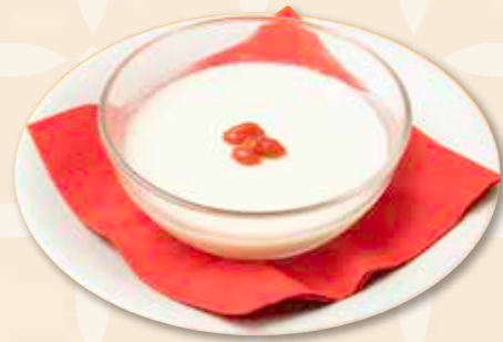
杏仁豆腐 杏仁豆腐 Almond Jelly 660