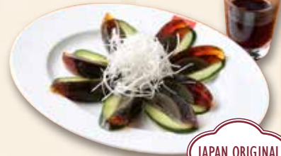
ピータン 皮蛋 Century Egg 750