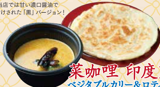
菜咖喱 印度煎饼 ベジタブルカレー&ロティプラタ

海老ペーストを漬け込んだ手羽元の唐揚げ シンガポールでは親しみのある フライドチキン料理。