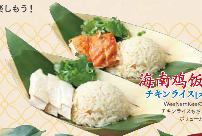
海南鸡饭 [白鸡/烧鸡] チキンライス [スチーム/ロースト]

WeeNamKeeの看板メニュー、 チキンライスもさく飲みに丁度いい ボリュームで登場!