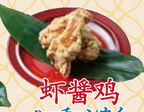
虾酱鸡 ハーチョンカイ

卵と大根餅 (キャロット) を炒め、 当店では甘い濃口醤油で 味付けされた「黒」バージョン!