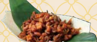
江魚仔 イカンビリス

マレー風のだしじゃこ。 サンバルソースとピーナッツと共に 揚げた箸の止まらないおつまみ。