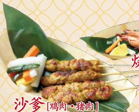
沙爹 [鸡肉・猪肉] サテー [鶏・豚]

WeeNamKeeの看板メニュー、 チキンライスもさく飲みに丁度いい ボリュームで登場!